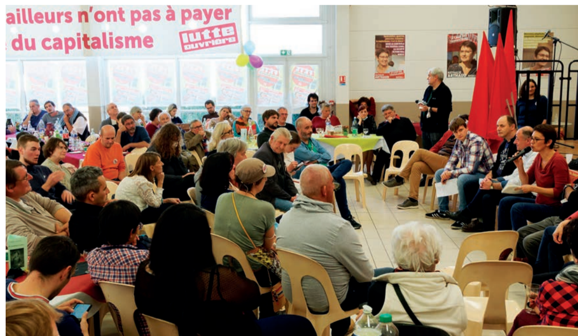
Nathalie Arthaud à la fête de Reims, le 24 octobre.