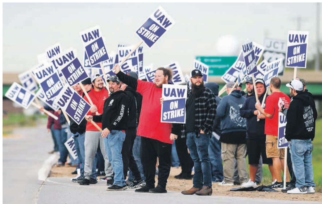
Piquet de grève devant John Deere à Davenport, dans l'Iowa.

Cette grève sur les salaires n'est pas la seule en