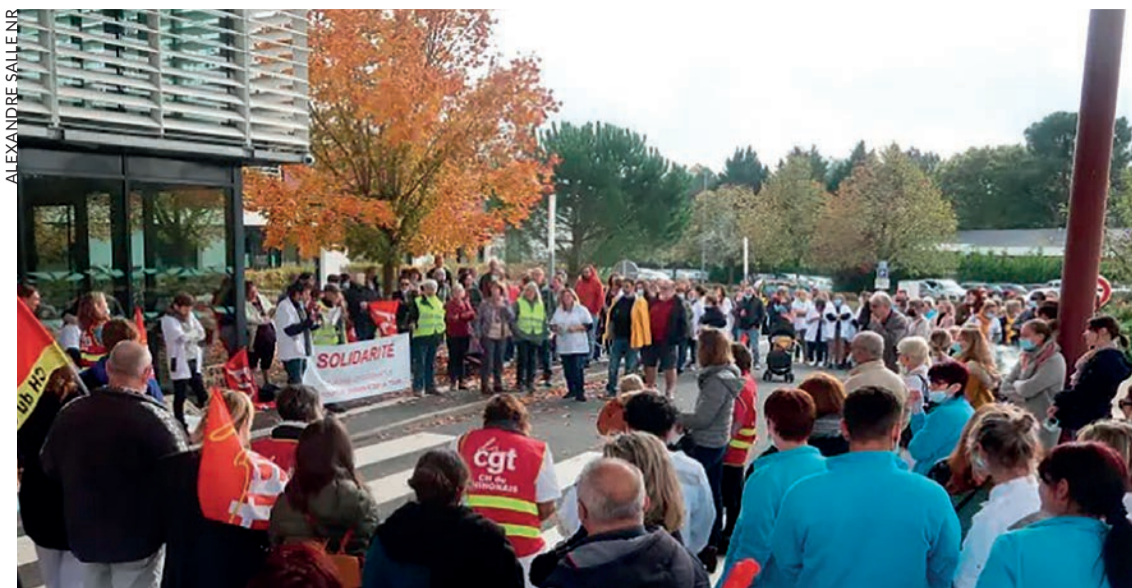
À l'hôpital de Chinon, le 25 octobre. Grève contre l'alternance jour/nuît.

Selon les dires du ministre de la Santé, Véran, « on assiste à une tendance à la hausse, à une petite poussée » des contaminations de coronavirus en France et en Europe. Toutefois, il n'y aurait pas « d'augmentation des hospitalisations », a-t-il ajouté, se voulant rassurant.