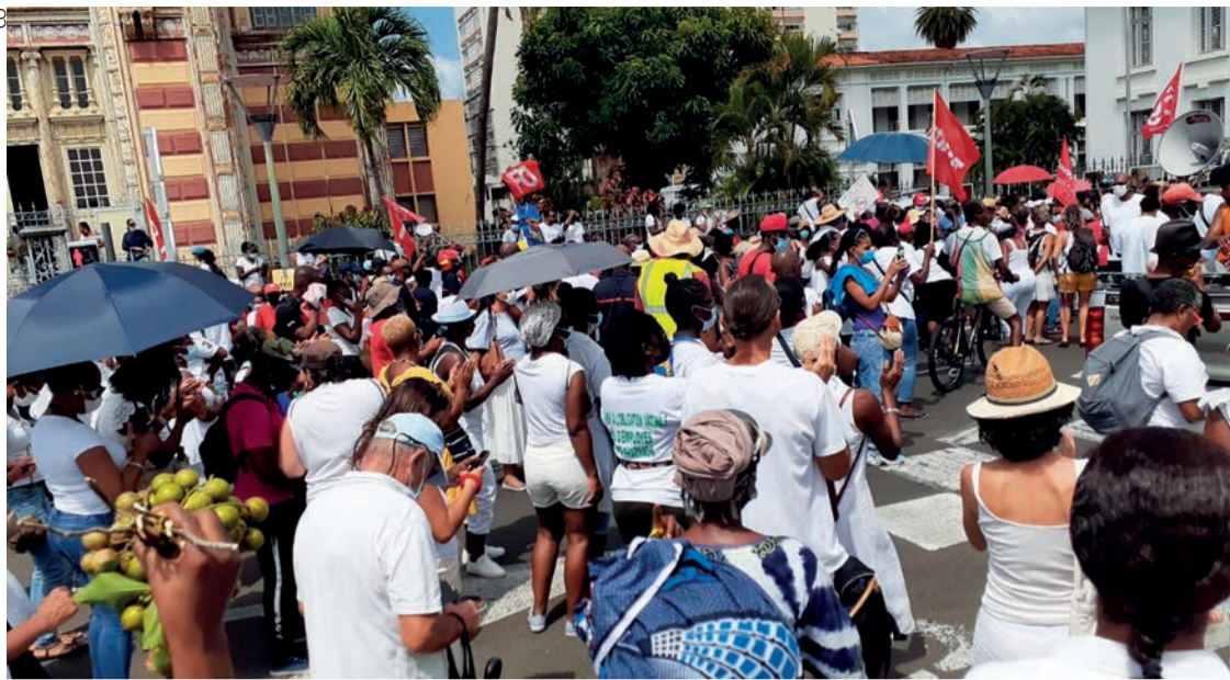
La manifestation du 25 octobre à Fort-de-France devant la préfecture.