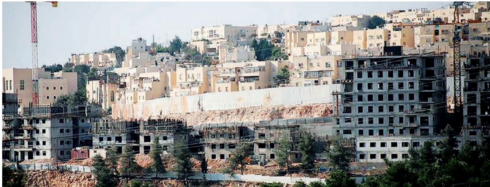
Colonies israéliennes en Cisjordanie.