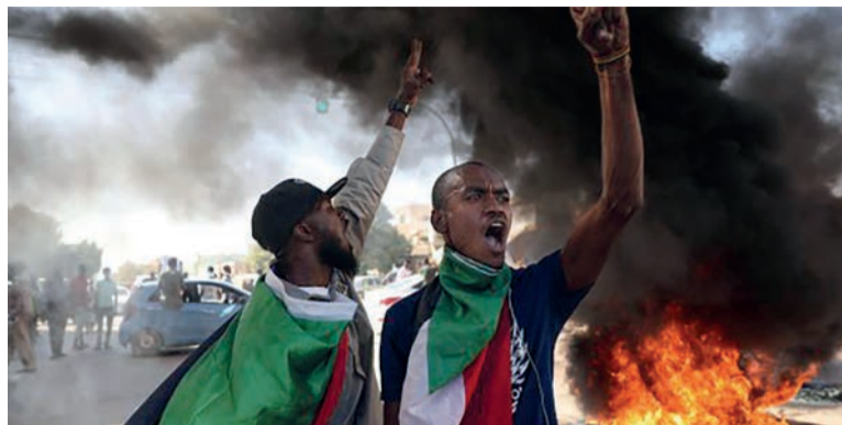
Khartoum, le 21 octobre: manifestants contre le coup d'État militaire.

En fait de partage, cet accord laissait tout le pouvoir réel entre les mains des généraux. Ils gardaient la haute main sur l'armée, la police et la justice. Les civils, quant à eux, occupaient des postes où ils avaient en charge la gestion de l'économie, à condition toutefois de ne pas toucher aux propriétés et aux entreprises appartenant à l'armée. Les généraux contrôlent 250 sociétés dans tous les secteurs vitaux et sont à la tête de très nombreux trafics. Le rôle des dirigeants civils se résumait