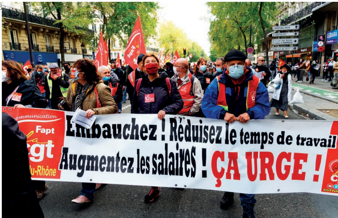
Manifestation de la CGT contre la précarité, en 2020.