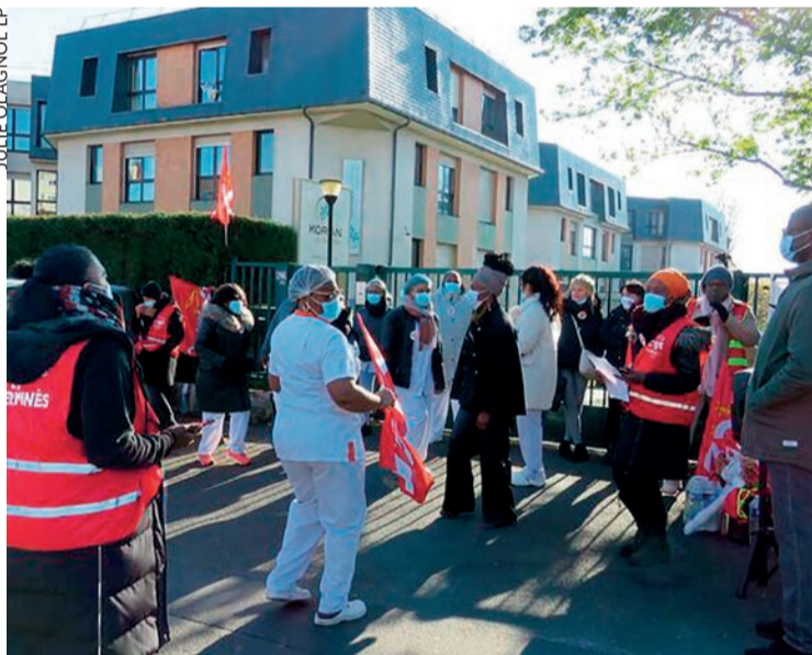
Grève début octobre à l'Ehpad Korian de Sarcelles.