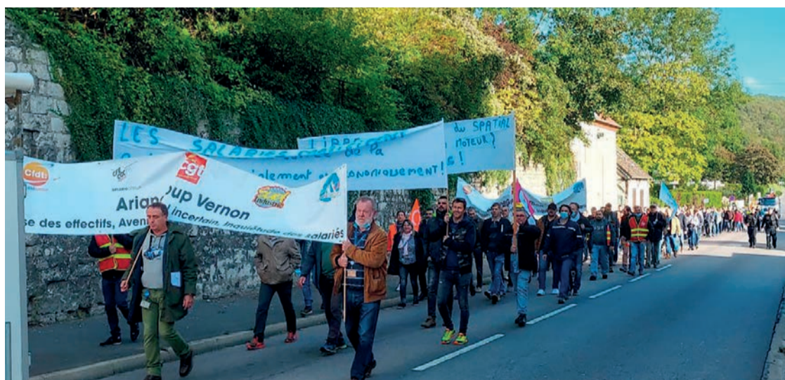
Manifestation du 4 octobre à Vernon.