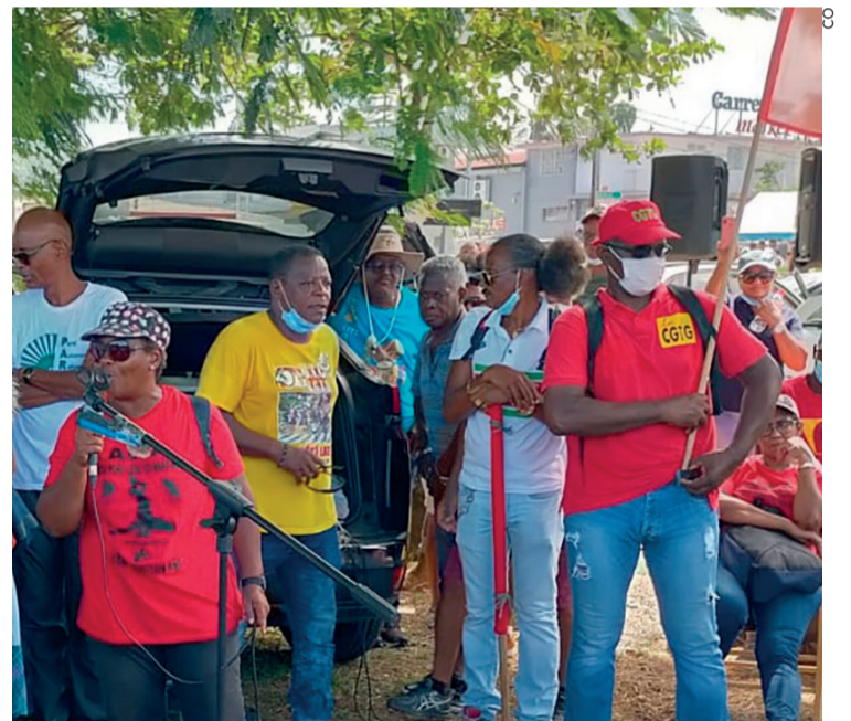
Prise de parole après la manifestation de Sainte-Rose, le 23 octobre.