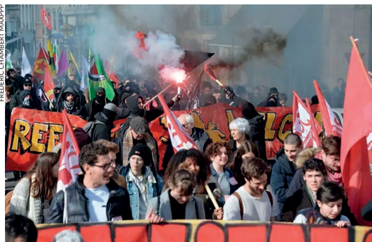
Manifestation à Lyon le 23 octobre.