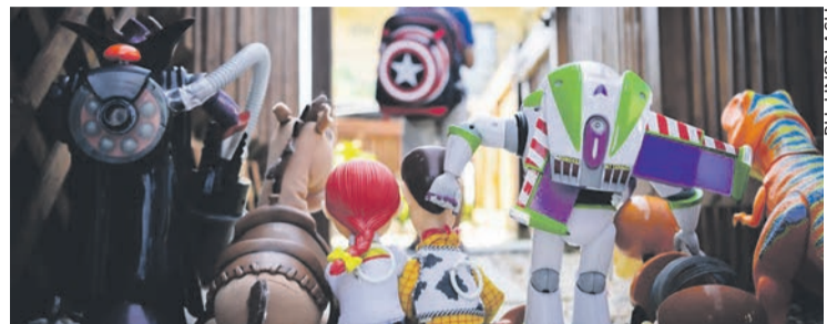
Le prix des jouets aussi ne cesse d'augmenter.