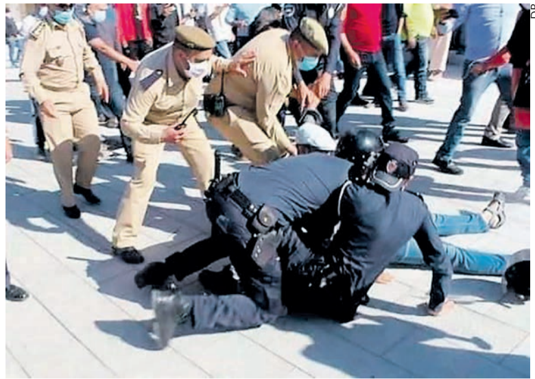
Manifestation antipasse réprimée à Rabat, dimanche 24 octobre.

Cette nouvelle attaque contre les classes populaires intervient dans un contexte de crise dramatique. L'économie ne s'est pas remise de son arrêt pendant plusieurs mois de confinement, le secteur touristique est toujours exsangue. L'inflation s'accélère : les prix des produits de base, l'huile, les lentilles, la