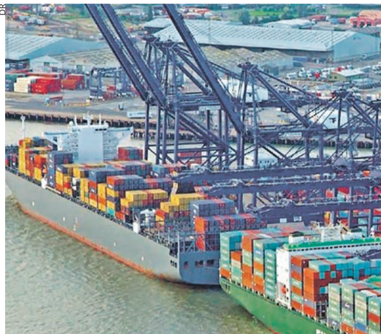
Le port de Felixstowe.