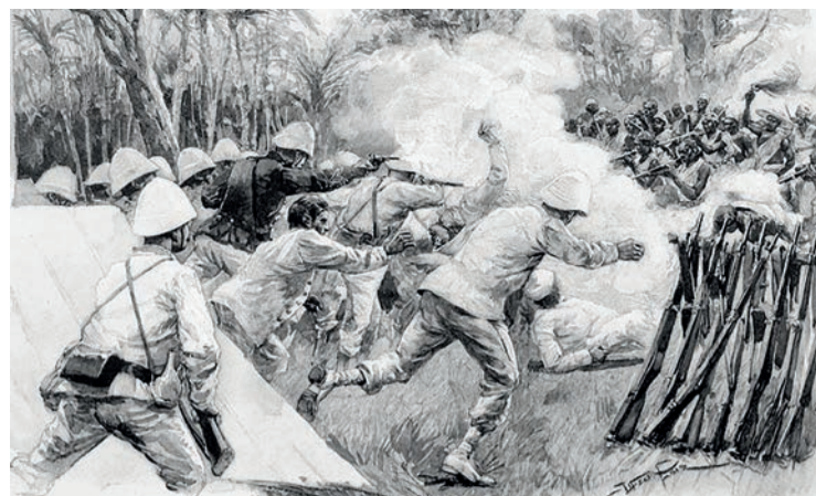
Les troupes françaises sous la direction de Dodds à Dogba, actuel Bénin, en 1892.

C'est de la collection de ce général Dodds que proviennent les œuvres en question. À part cela, le pillage, ce sont les équipes