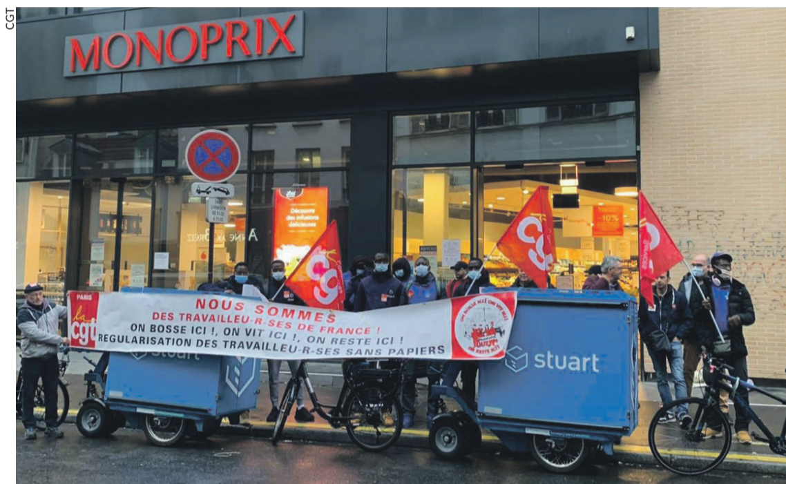
Grévistes sans papiers au Monoprix de Belleville.