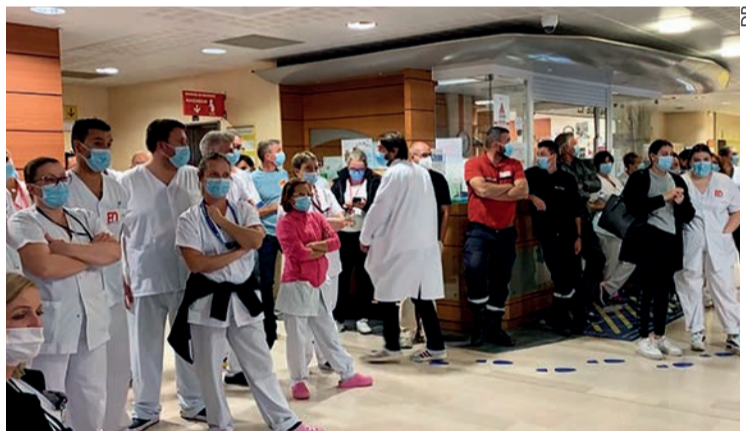
Assemblée générale à l'hôpital de Sète le 14 octobre.

Un rassemblement était organisé à 13 heures. Plus de 100 blouses blanches ont répondu à cet appel, ce qui faisait chaud au cœur, comme le disait une aide-soignante. Les explications fumeuses de la direction, évoquant la pandémie de Covid-19 et