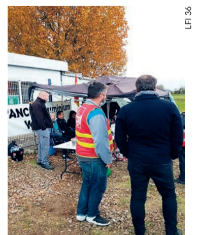
Au piquet de grève.