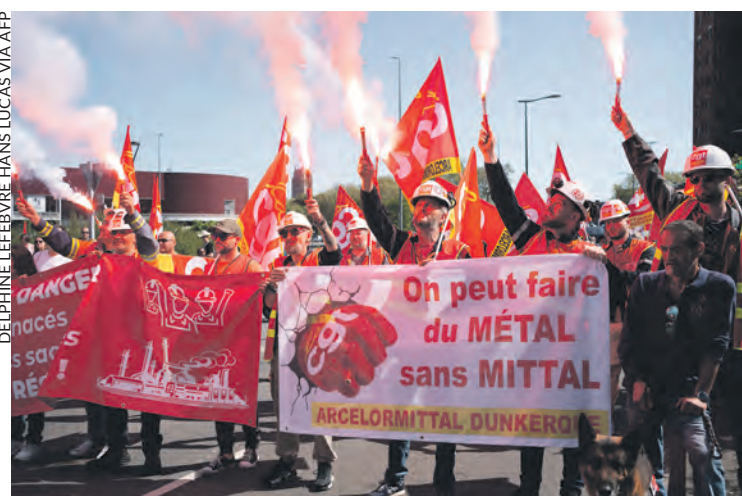
Dans la manifestation du 1 er Mai à Dunkerque.