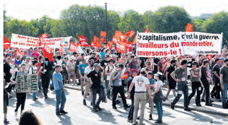
Le 1 er mai, à Paris.

appartenant à la majorité. Actuellement, selon le code du travail, seuls sont autorisés à faire travailler leurs salariés les établissements « qui, en raison de la nature de leur activité, ne peuvent interrompre le travail », par exemple les hôpitaux. Il s'agirait de remplacer cette formule par une autre beaucoup plus large qui dirait : « dont le fonctionnement ou l'ouverture sont rendus nécessaires par les contraintes de la production, de l'activité ou les besoins du public ». Ce sont exactement les termes