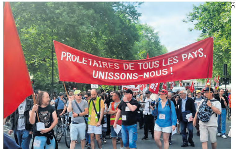
Le 1 er mai, à Rennes.

Ce n'est pas cette politique que proposent les confédérations syndicales. Loin de concentrer les forces et de préparer une contre-offensive du monde du travail, elles pleurent sur les mauvais choix