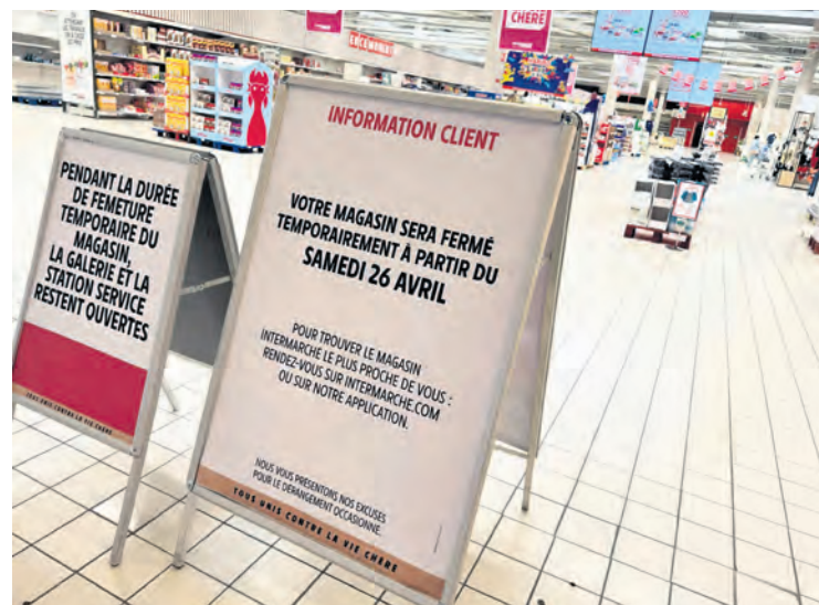
Intermarché, ex-Casino, Plan-de-Campagne.

Les propriétaires de ces groupes n'ont rien à faire de telles préoccupations. Ils multiplient les ouvertures, y compris dans les mêmes zones et les mêmes quartiers, se livrent entre eux à une guerre commerciale acharnée, tout en guettant le moment où l'un d'entre eux connaîtra des difficultés,