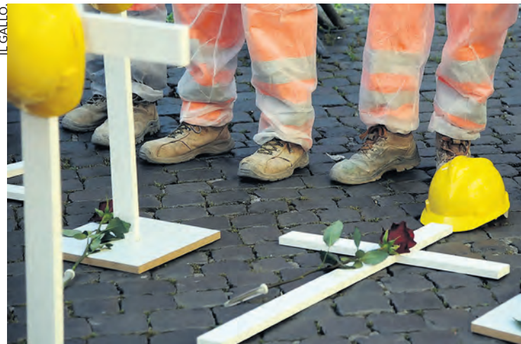
Cinq morts au travail en deux jours dans la province de Lecce en septembre 2023.

Cet article est traduit du journal édité par nos camarades de L'Internazionale (Italie - UCI), n° 200, avril 2025.