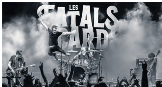
Les Fatals Picards.