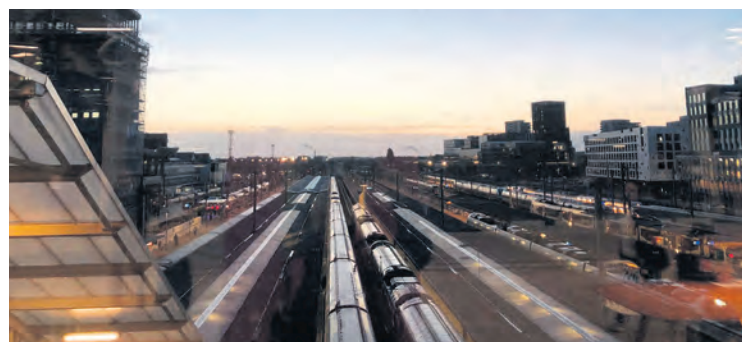
À Nantes, un quai vide lors de la grève du 5 mai.

Les revendications des contrôleurs grévistes pourraient très bien être celles de l'ensemble des cheminots. Tous sont concernés par le sous-effectif, l'augmentation des cadences, tous ont besoin d'augmentations de salaires. Tous sont aussi concernés par les pertes sur un salaire souvent constitué de primes quand, en raison du recul de l'âge de la retraite et de