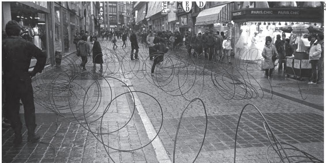
Les rues de Metz encombrées par du fil de fer dévidé par les sidérurgistes en 1984.

En 2008, la fermeture de l'aciérie de Gandrange en Moselle fut annoncée par