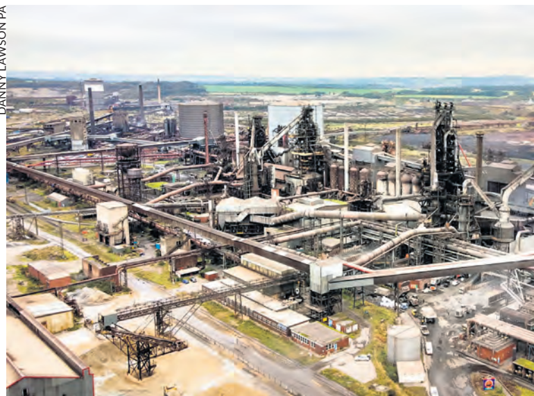
British Steel Ltd à Scunthorpe dans le North Lincolnshire.

Comme en France, cette mesure est présentée comme