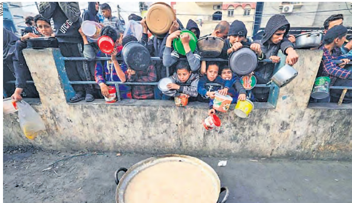
Khan Younes le 4 mai, les enfants attendent la distribution de nourriture.