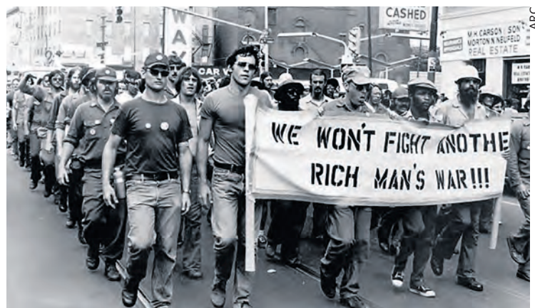
Anciens combattants du Vietnam manifestant contre la guerre : « Nous ne ferons pas une autre guerre pour les riches ! »

Bien des soldats envoyés au Vietnam étaient issus de la population afro-américaine, alors même que la lutte pour l'égalité des droits était de plus en plus vive en son sein. Pour la population noire, cette guerre n'était pas la sienne. « Aucun