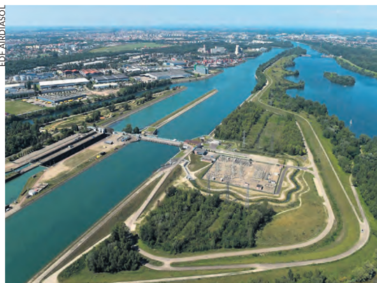
Le Rhin en Alsace.

Dans l'agglomération de Saint-Louis, qui compte 60 000 habitants, le préfet du Haut-Rhin a interdit la consommation d'eau du robinet aux nourrissons, femmes enceintes ou allaitantes, personnes âgées et malades immunodéprimés à partir du 5 mai et pour une durée inconnue.