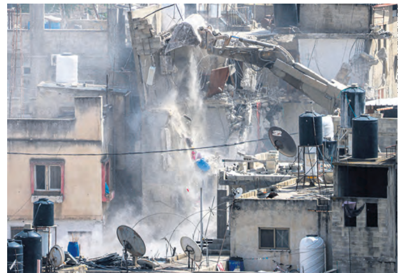
L'armée israélienne détruit un immeuble à Tulkarem, en Cisjordanie.

des affrontements entre milices djihadistes et druzes qui ont eu lieu fin avril, l'aviation israélienne a lancé des raids contre plusieurs sites militaires. Le 2 mai, un quartier situé près du palais présidentiel, dans la capitale, Damas, a été pris pour cible. Pour justifier son intervention, Netanyahu se pose en protecteur des quelque 700 000 Druzes de Syrie menacés de persécutions par les islamistes ayant accédé au pouvoir après la chute de Bachar al Assad. C'est un comble de la part du dirigeant d'un État qui occupe depuis 1967 une partie du plateau du Golan, contre la volonté des Druzes qui y vivent ! En réalité, les dirigeants israéliens se moquent bien de ce qu'il pourrait advenir aux Druzes de Syrie. Au contraire, en prétendant les protéger, ils cherchent à