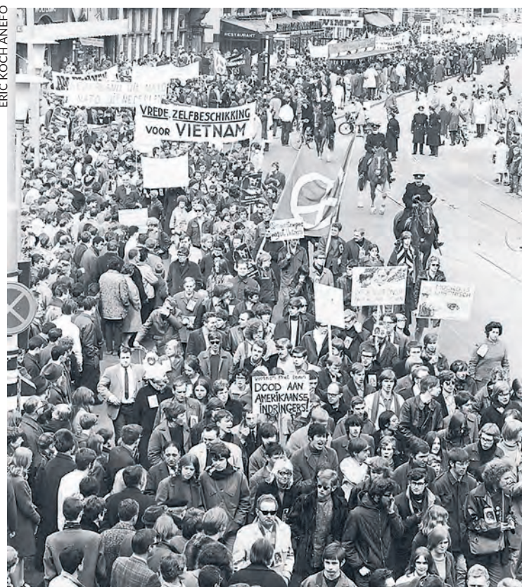
Manifestation contre la guerre au Vietnam à Amsterdam en avril 1968.