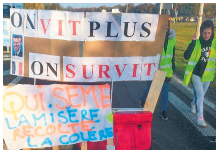
Gilets jaunes en novembre 2018 à Ressons-sur-Matz, dans l'Oise.