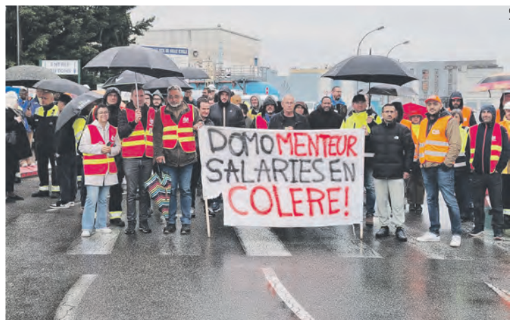
Rassemblement du 16 avril 2025.

À l'usine chimique de Domo Belle-Étoile au sud de Lyon, qui compte environ 650 salariés, la lutte des travailleurs se poursuit face aux 155 licenciements annoncés mi-mars.