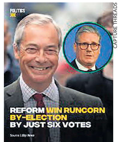
Farage et Starmer.

Les résultats du 1 er mai sont donc un revers pour le gouvernement, en même temps qu'ils confirment le glissement à droite d'une fraction notable de l'électorat. Ce cours rétrograde doit beaucoup aux politiciens tant conservateurs que travaillistes qui ont banalisé les discours antimigrants dont Reform UK fait son fonds de commerce. Et il ne sera stoppé que lorsque la classe ouvrière retrouvera le chemin