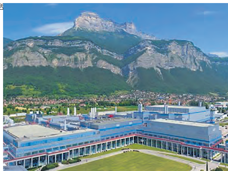
L'usine STMicroelectronics de Crolles.

La direction de STMicroelectronics, le « champion européen des semi-conducteurs », a annoncé fin avril la suppression d'environ 2 800 postes sur les 50 000 existant au niveau mondial, dont 1 000 en France. Elle prétexte notamment la crise du marché de l'automobile.