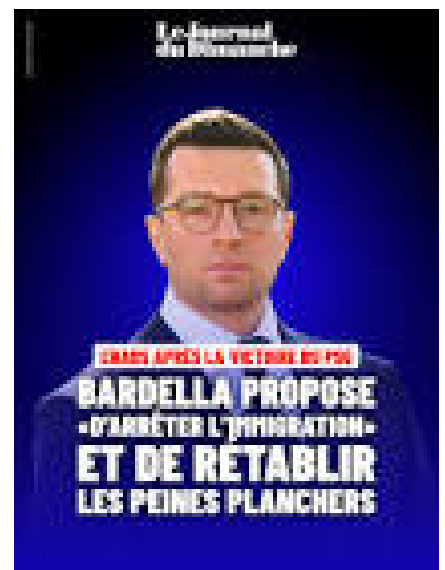
La UNE du JDD

Bardella n'est pas « horrifié » par cette société-là. Au contraire il aspire à la gérer. Et, pour y parvenir, il exploite les peurs, invente des coupables commodes et distille son poison anti-immigrés.