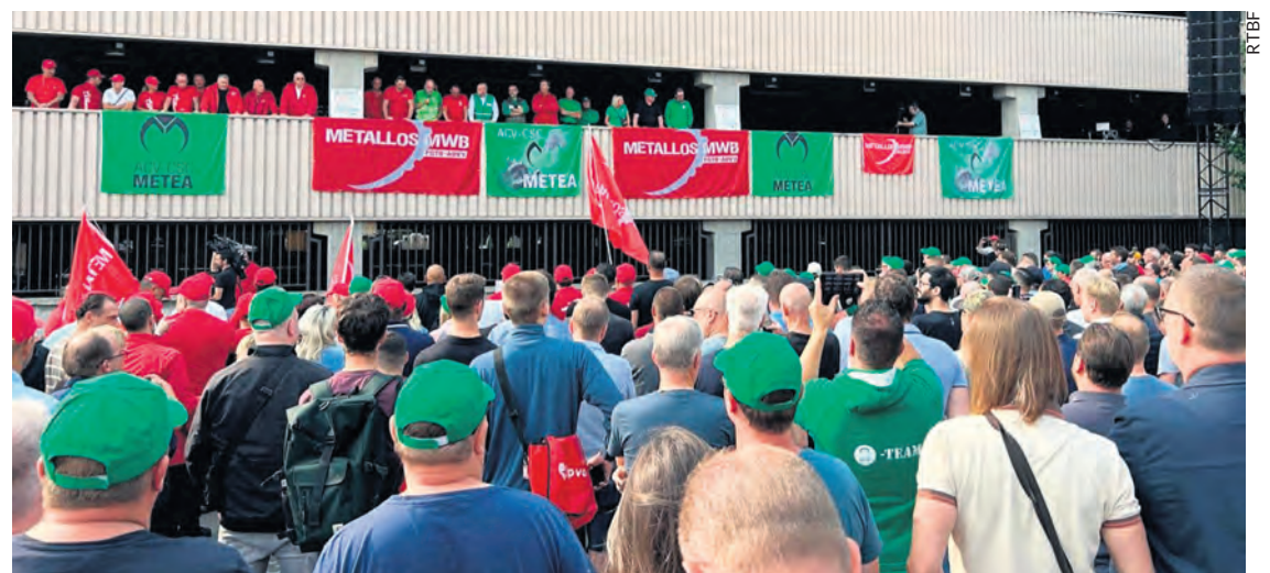
Rassemblement devant l'usine Audi de Forest le 20 août.