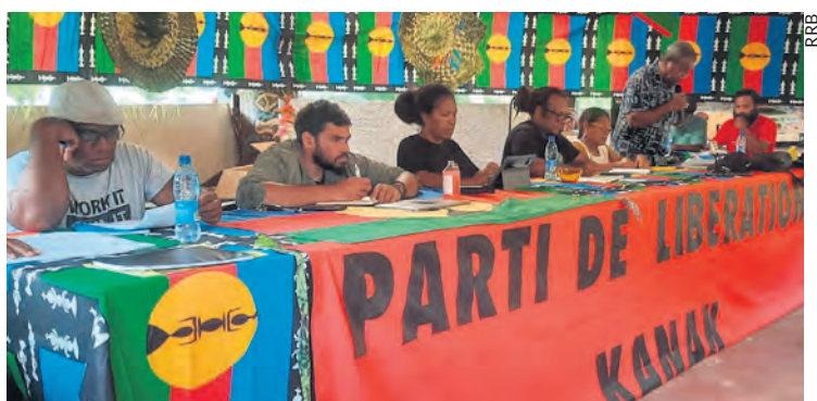
Conférence du Palika.