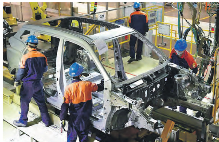
Ouvriers de Geely à Baoji.

La direction prépare ainsi les esprits pour de prochaines attaques contre les