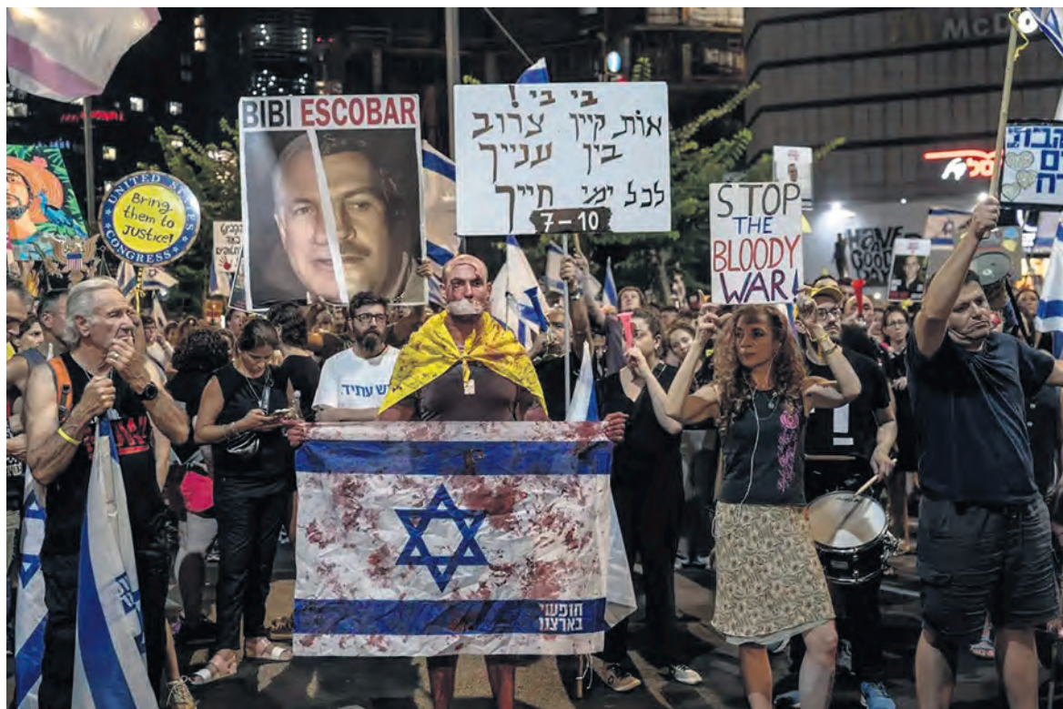
Le 31 août à Tel Aviv.

De son côté, la principale centrale syndicale israélienne, la Histadrout, appelait à la grève générale lundi 2 septembre afin de faire pression sur le gouvernement pour qu'il cesse de saboter les négociations et qu'il conclue un cessez-le-feu immédiat pour le retour des otages. La grève a, semble-t-il, été relativement bien suivie dans l'éducation, les aéroports, les ports, les banques, les compagnies d'électricité, la poste et les transports. À Tel-Aviv, le maire a appelé à la grève. À la demande du ministre d'extrême droite des Finances, un tribunal du travail a ordonné