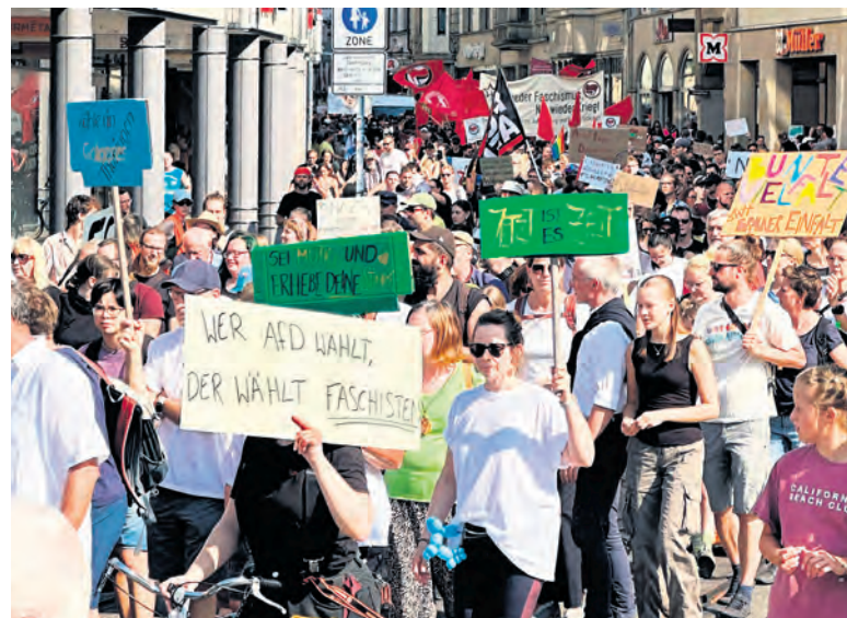
Manifestation le 31 août contre l'AfD à Erfurt.

Ces aspects ont été présents dans sa campagne, mais ce qui a fait le plus de bruit est son exigence d'arrêter les livraisons d'armes à l'Ukraine, de refaire parler la diplomatie pour entamer des négociations de paix. Dans sa