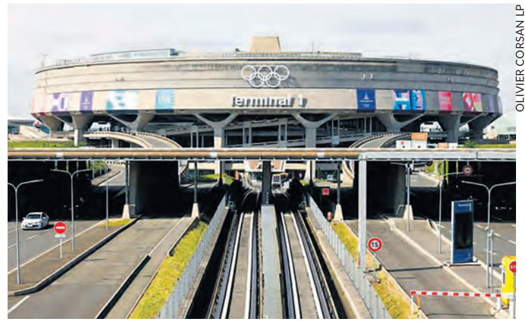
OLIVIER CORSAN LP

Pour certains des embauchés de l'été, comme les bagagistes de chez Onet, ce n'était pas la joie. Ainsi, parmi les 500 CDD environ recrutés cet été, plus de la moitié sont partis au bout de quelques jours, écœurés des conditions de