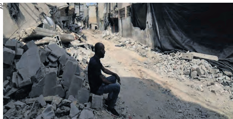
Le camp de Nour Shams en Cisjordanie le 30 août.

Mercredi 28 août, l'armée israélienne a engagé sa plus grande opération militaire en Cisjordanie depuis vingt-deux ans.